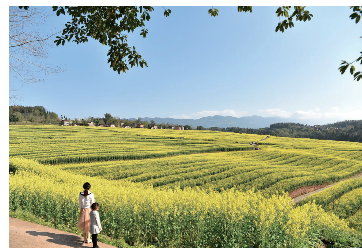
千亩油菜花盛开美如画

此外,各单位选派和指导员(不包括由驻村第一书记兼任的指导员)将于近期全部到岗工作。我市还将每年至少对指导员开展一次集中培训,以此增强其工作能力。